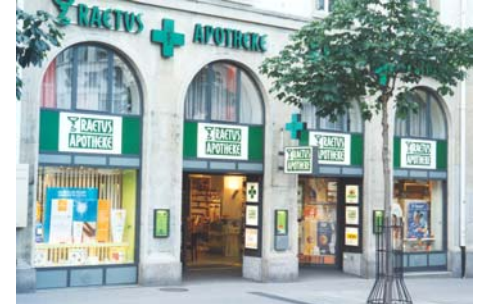
Leitung: L. Brügger, Offizinapotheker FPH